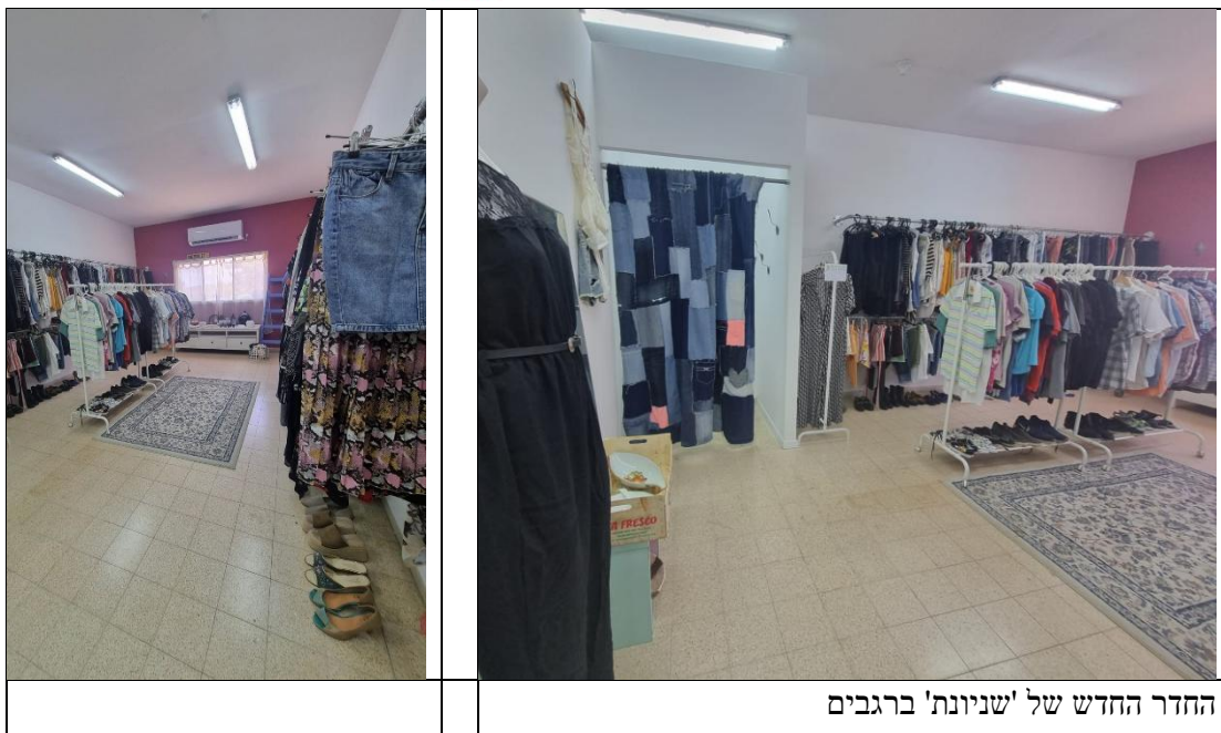
החדר החדש של 'שניונת' ברגבים

אום אל קושוף • אלוני יצחק • אל עריאן • ברקאי • גן השומרון • גן שמואל • כפר גליקסון • כפר פינס • להבות חביבה • מאור • מגל • מי עמי • מייסר • מצפה אילן • מצר • מענית • משמרות • עין עירון • עין שמר • קציר • רגבים • שדה יצחק • שער מנשה • תלמי אלעזר